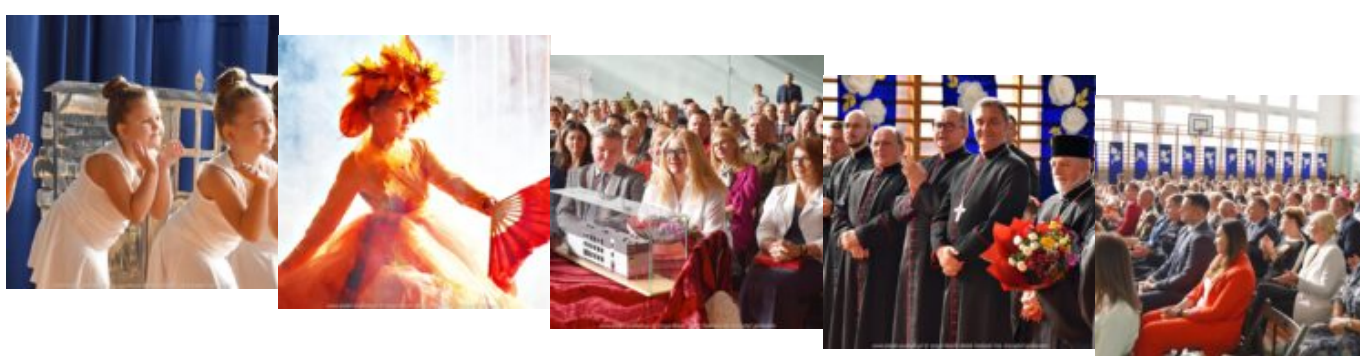
Tagi: Dzień Nauczyciela , edukacja , jubileusz , sekretarz miasta , Szkoła Podstawowa numer 2 ,